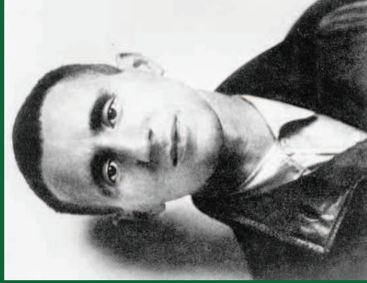
La canción del comerciante. Bertolt Brecht