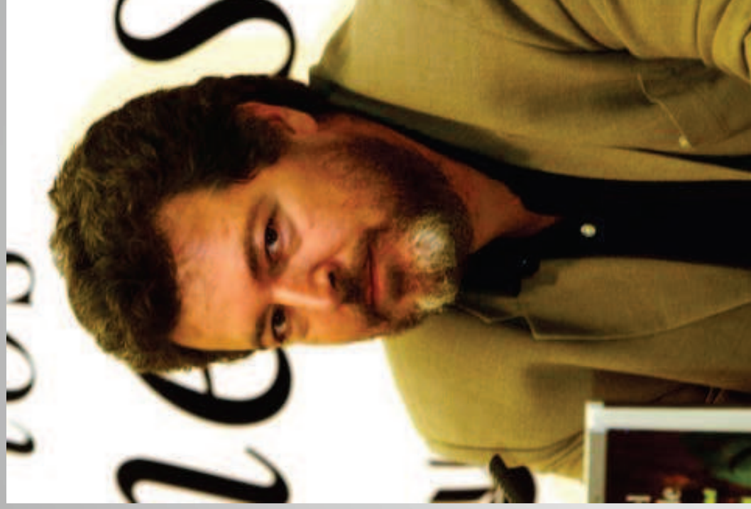
Juan López de Uralde