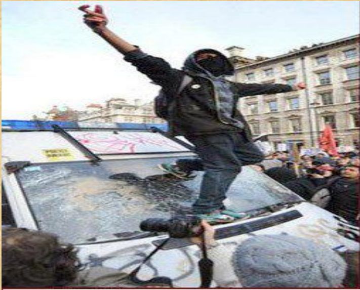
LONDRES Noviembre 2010

«Los anarquistas infiltrados en las manifestaciones estudiantiles serán detenidos y castigados con todo el rigor de la ley...»