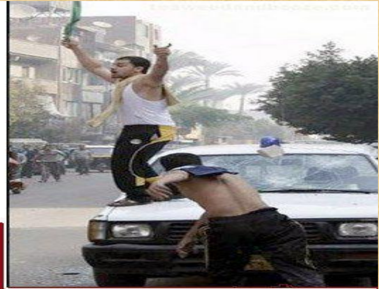
EL CAIRO Febrero 2011

«Sí, el cambio debe empezar ahora, para demostrar al pueblo egipcio que sus aspiraciones han sido entendidas...»