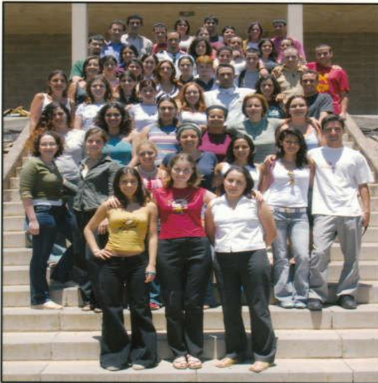
Sociología 1999 - 2003