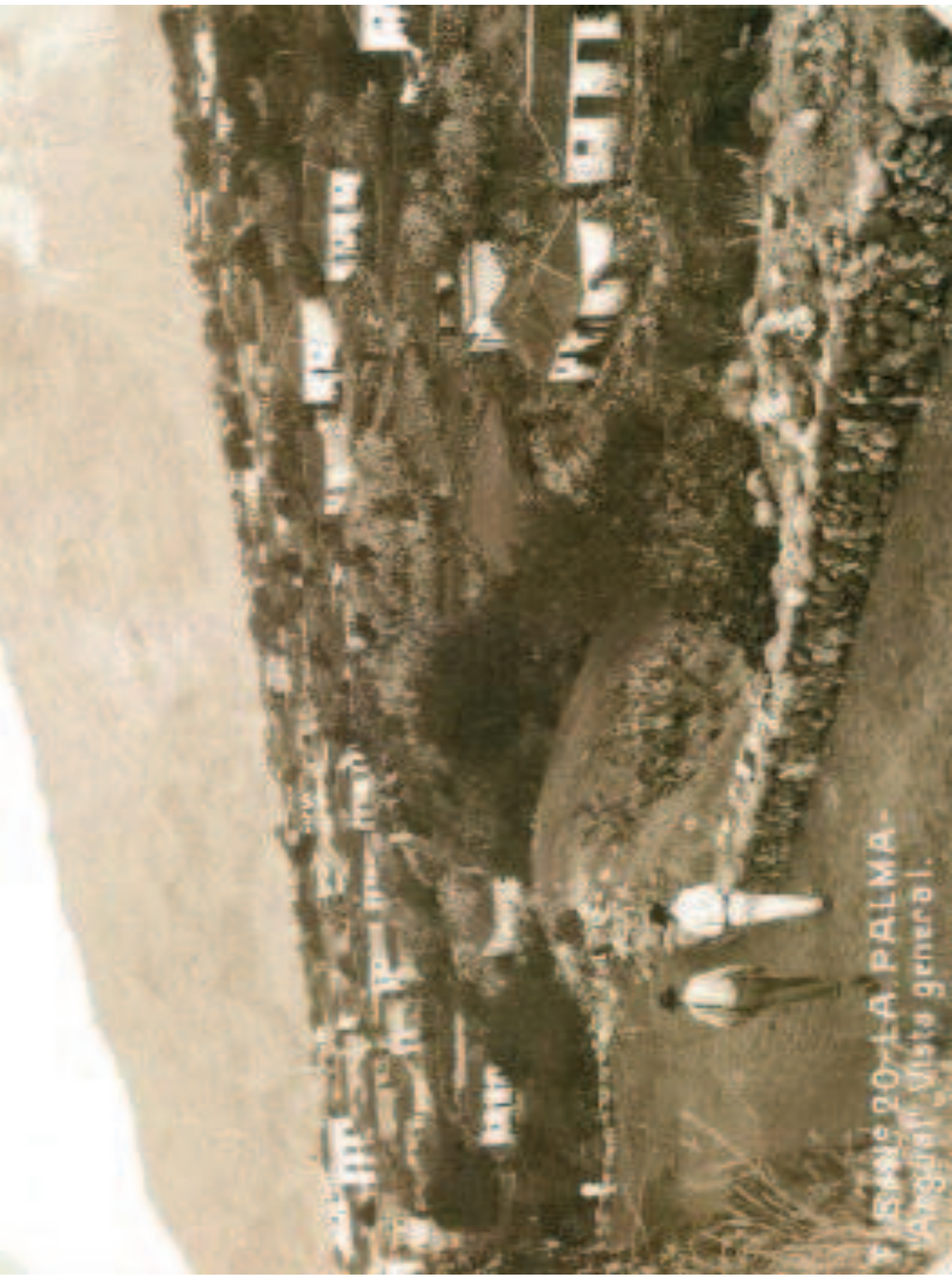
F. S. 20-1-A. PALMA- Angaité. Vista general.